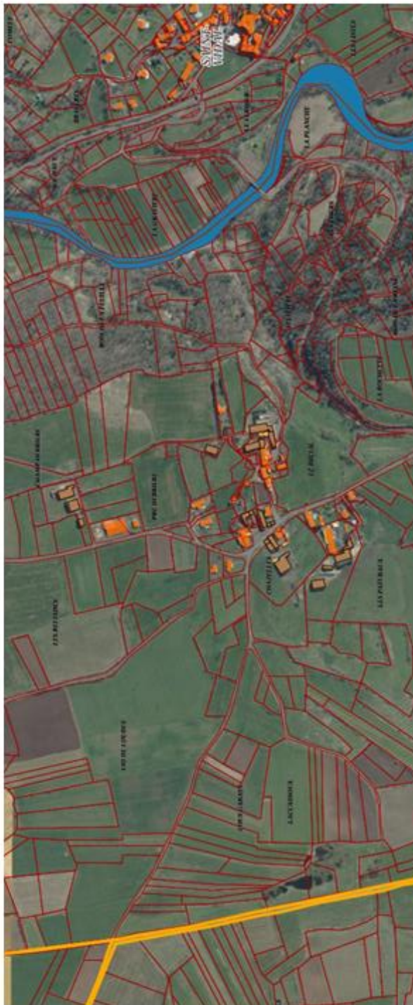
Saint-Vidal : Chazelles