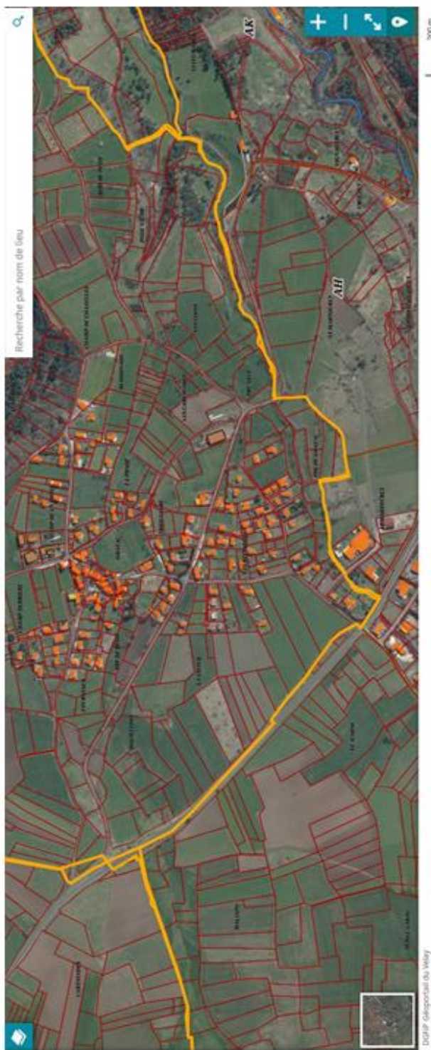
Saint-Vidal : Grazac, zone du Martouret