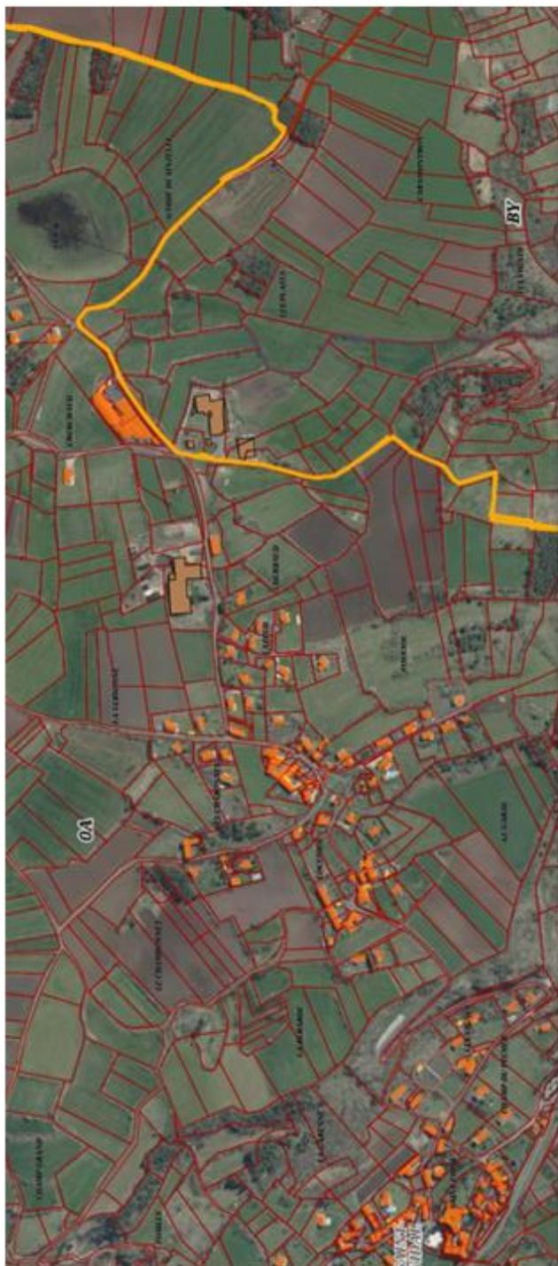
Saint-Vidal : Locussol